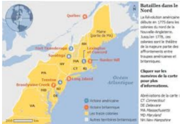
Les 13 colonies

1783, le 3 Septembre : le traité de Versailles confirme l'indépendance des Etats-unis,