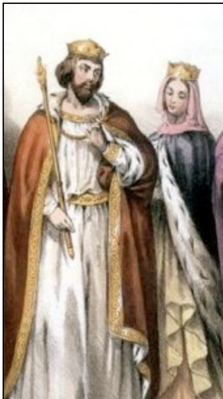
Robert II le Pieux et son épouse Constance d'Arles

972? -naissance de Robert à Orléans, il est le fils de Hugues Capet et de Adélaïde de Poitiers (ou d'Aquitaine).