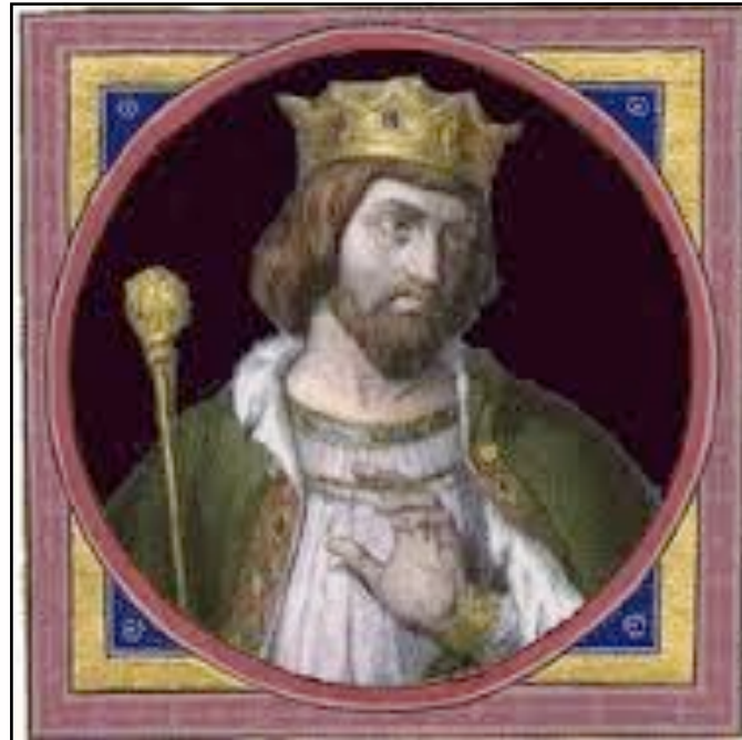
Robert II le Pieux