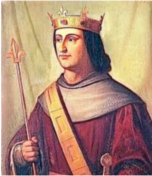
Philippe VI de Valois