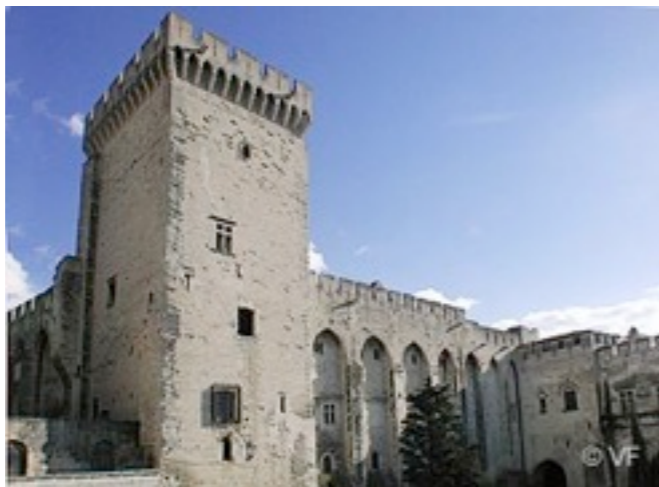
le Palais Vieux

1328 -1er février : mort de Charles IV le Bel, dernier roi capétien, descendant direct de Hugues Capet.