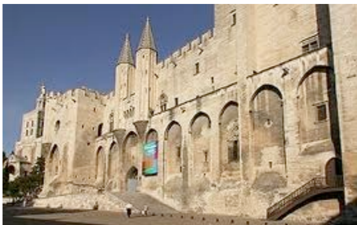
le Palais Neuf

1340 6 Février : Edouard III se fait appeler roi de France. 24 Juin : bataille navale de l'Ecluse : victoire de l'alliance anglo-flamande sur la flotte française, qui assure aux Anglais le contrôle de la mer pour de nombreuses années.