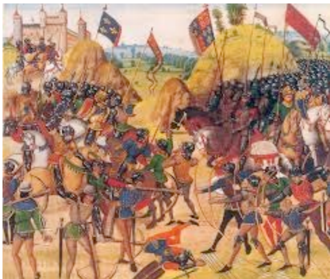
la bataille de Crécy