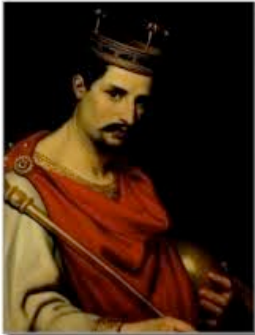
Charles II le Chauve